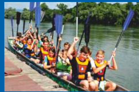
Szenen von HandballCamps 2011 und 2013